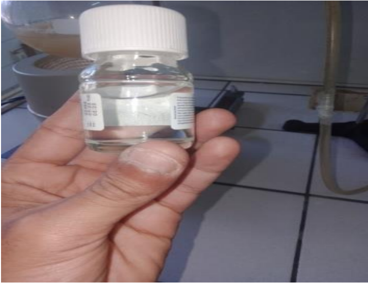
إيثانول مركز ethanol